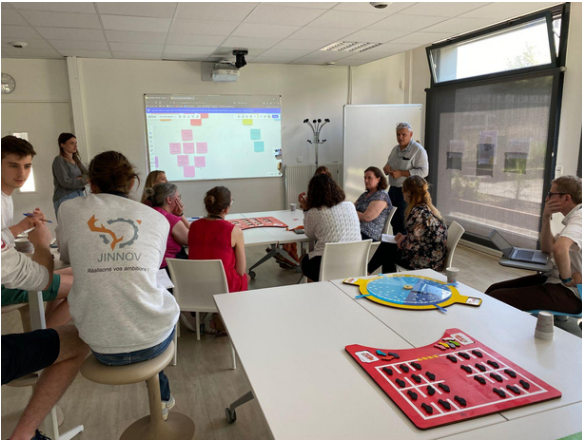
Photo de l'atelier de simulation

En juillet 2022, les différentes parties prenantes du projet se sont réunies (Université Catholique de Lille, 4 structures du quartier, étudiants ICAM, les étudiants JINNOV de l'INSA) pour simuler le fonctionnement du parking et définir ses règles de fonctionnement.