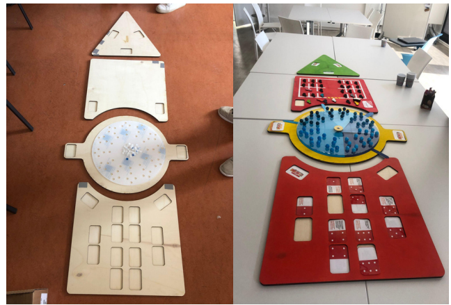
Plateau de jeu de l'atelier

Grâce aux différents scénariis, 4 axes ont été travaillés :