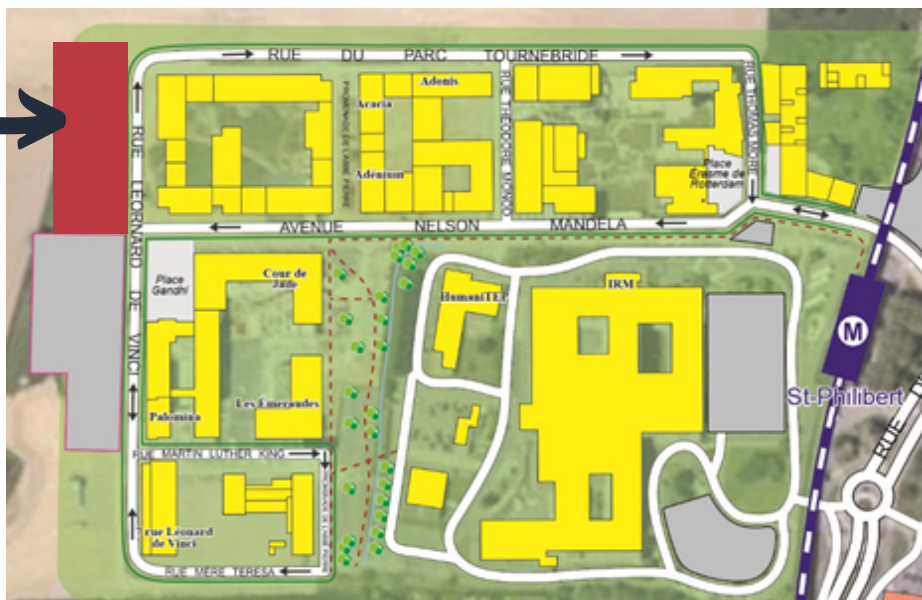
Parking "îlot 7"

La mission de l'Université ne peut pas être de gérer un parking public, la condition d'utilisation de ce parking est donc de trouver une solution de cogestion.